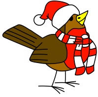
Fritt av Alf Prøysen, Julekveldsvisa